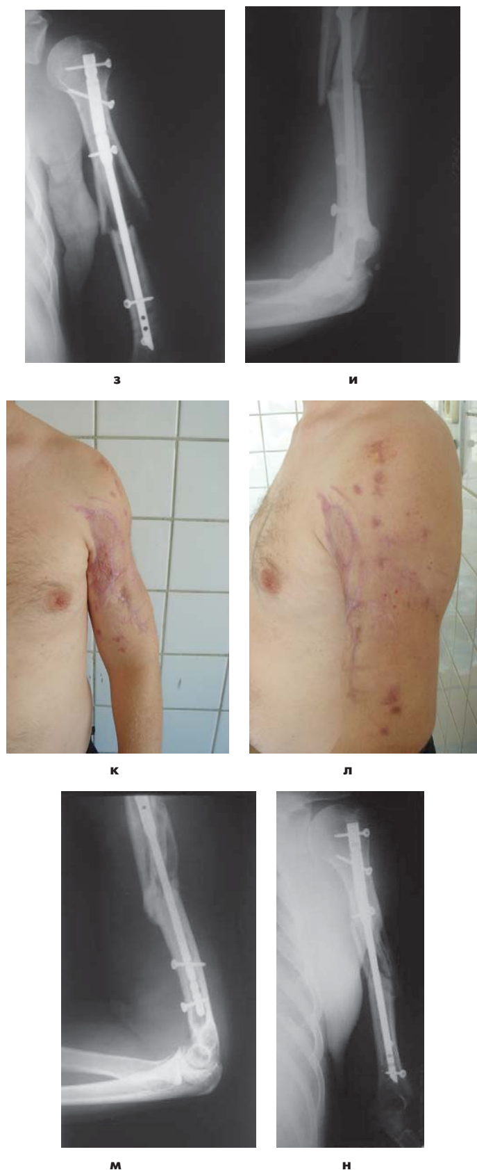
Рис. 3. Рентгенограммы и внешний вид пострадавшего К. а, б – при поступлении; в, г – после первичной хирургической обработки раны, пластики местными тканями и фиксации отломков внешним стержневым аппаратом; д – через 10 дней после травмы; ж, з, и – после интрамедуллярного остеосинтеза штифтом с активным антибактериальным покрытием; к, л, м, н – через 3,5 мес после травмы.

В случаях осложненного заживления раны, глубокого нагноения с исходом в остеомиелит, при