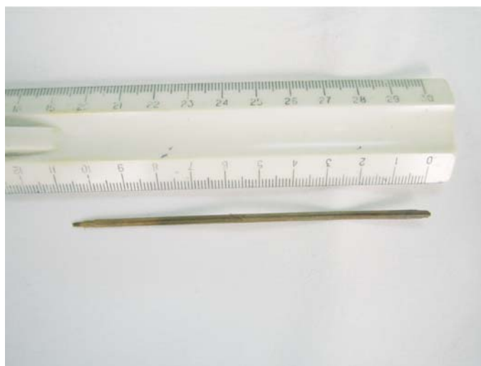
Рис. 2. Иностранное тело (шпатель).

В экстренном порядке больному выполнена рентгенография грудной клетки, которая показала, что диафрагма расположена обычно, уплощена. Наружный реберно-диафрагмальный синус слева не полностью раскрывается. Остальные реберно-диафрагмальные синусы свободны. Слева над диафрагмой плевральные наслоения. Массивные плевральные наслоения в передних синусах. Сердце погружено в диафрагму, без увеличения отделов, у верхушки тень жирового треугольника. Аорта уплотнена, не резко выражена.