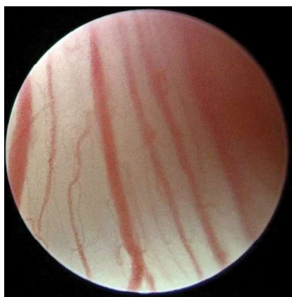
Рис. 1. Нулевой тип строения сосудистого русла: сосуды идут параллельно друг другу и поверхности слизистой оболочки