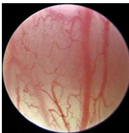
Рис. 2. Первый тип строения сосудистого русла: сосуды сохраняют параллельный ход, однако имеют значительно больше ответвлений и пересечений по сравнению с нулевым типом