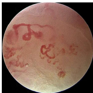
Рис. 5. Четвертый тип строения сосудистого русла: древовидно-разветвленный сосуд, перпендикулярно направленный к поверхности слизистой оболочки

Помимо положительных сторон использования контактной эндоскопии в полости рта в виде неинвазивности, возможности амбулаторного применения и быстроты проведения исследования, было отмечено большое количество недостатков именно при проведении исследования с окрашиванием [37]. Визуализация изменений только в поверхностных слоях слизистой оболочки, так как метиленовый синий не проникает глубже поверхностных слоев, не дает возможности верифицировать дисплазии. Некоторые авторы отмечают сложность точного и полного повторения техники проведения исследования с окрашиванием. Это не позволяет добиться когерентных результатов для проведения прозрачного сравнения данных между исследованиями [29].