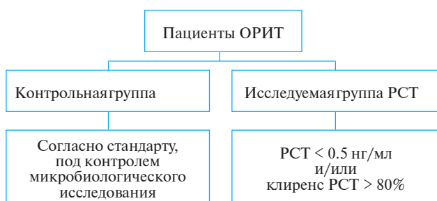
Рис. 1. Схема исследования пациентов ОРИТ с сепсисом и инфекционными осложнениями по лечению АБП под контролем теста на РСТ