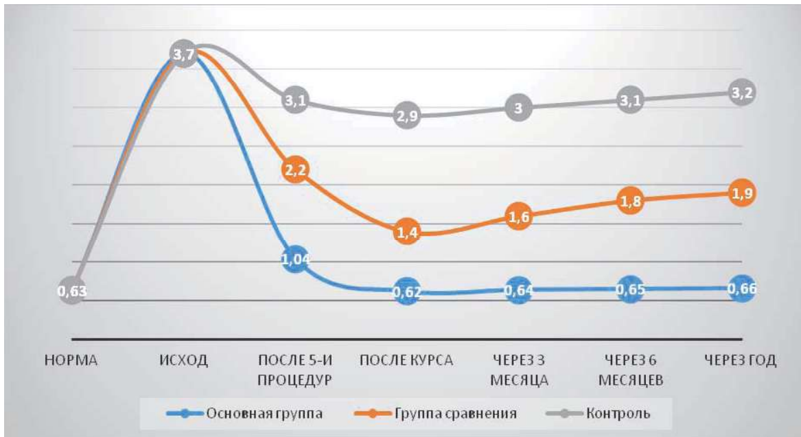
Рис. 2. Динамика показателей индекса Рассела у больных хроническим верхушечным периодонтитом в различные сроки лечения.

Для объективизации выраженности локального воспаления в тканях пародонта нами был применен широко известный пародонтальный индекс (ПИ) по Расселу, который в исходном состоянии был достоверно выше нормы в 5,87 раза ( 3,7 \pm 0,5 по сравнению с 0,63 \pm 0,01 в норме, p < 0,001 ), что характеризует активность воспалительного процесса в тканях пародонта у обследованных больных как средней степени тяжести (рис. 2).